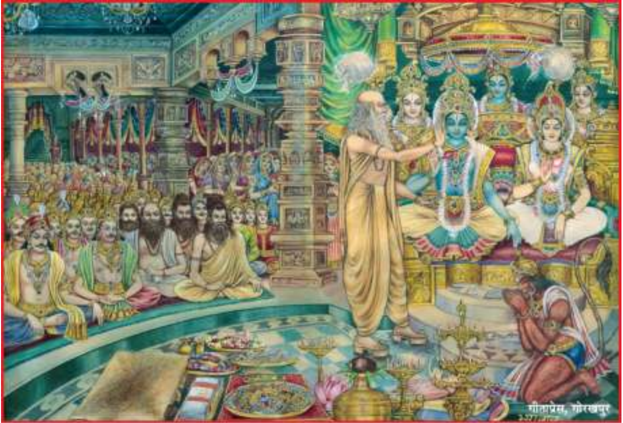
भगवान् श्रीरामका राज्याभिषेकः