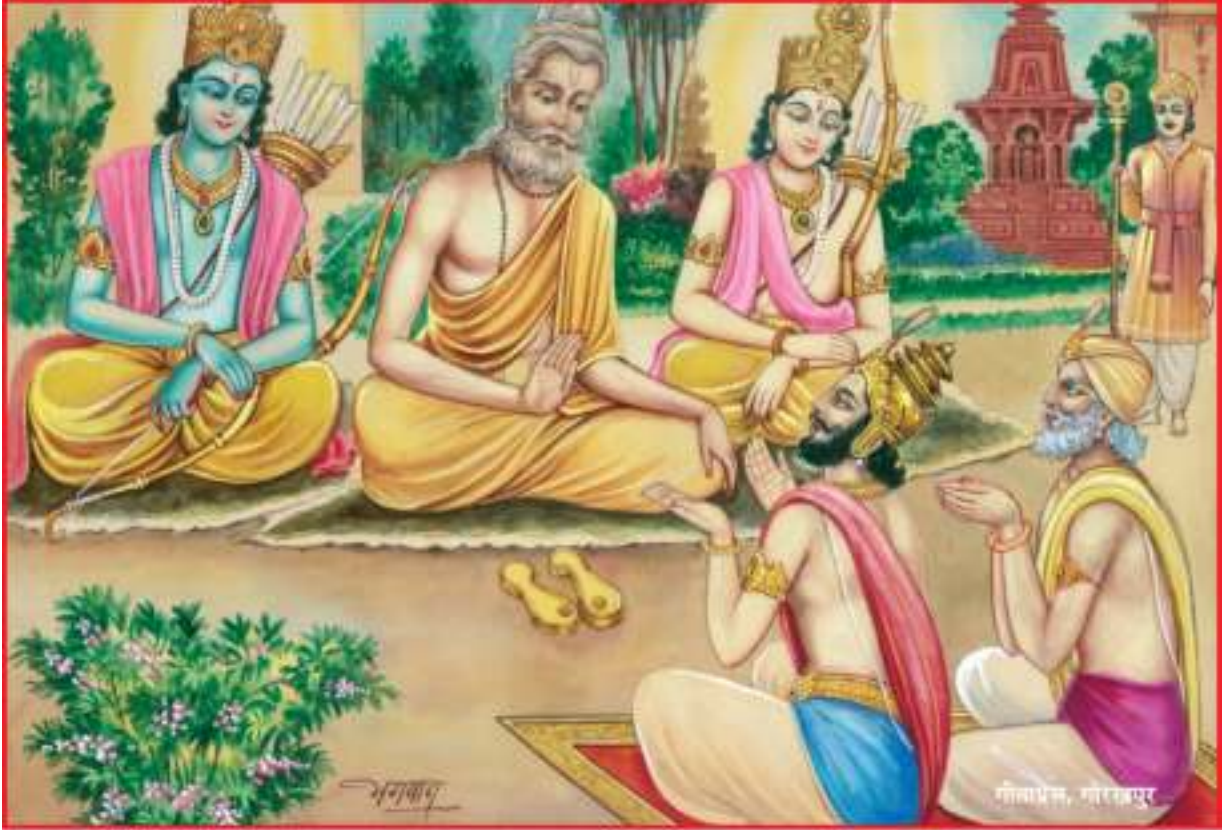
जनकद्वारा विद्वामित्रका स्वागत