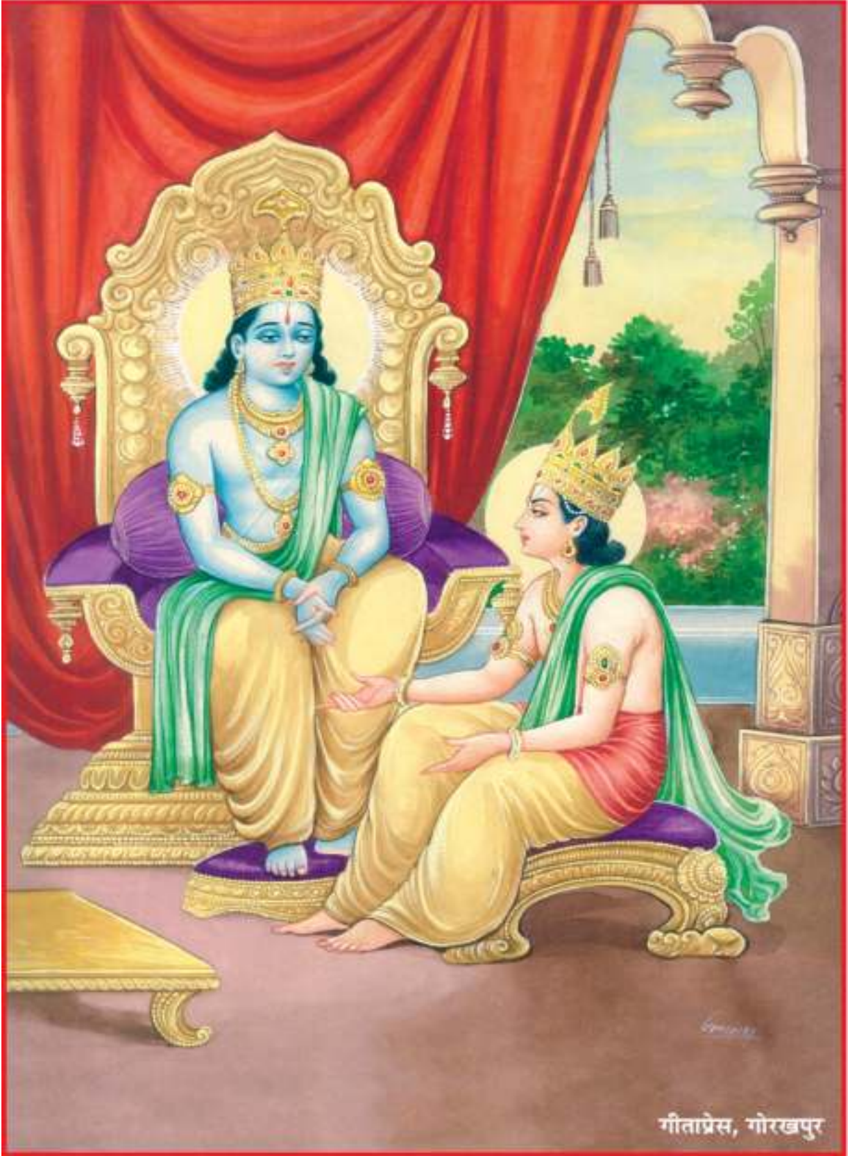
सीता-त्यागके पश्चात् लक्ष्मण श्रीरामके सान्निध्यमें