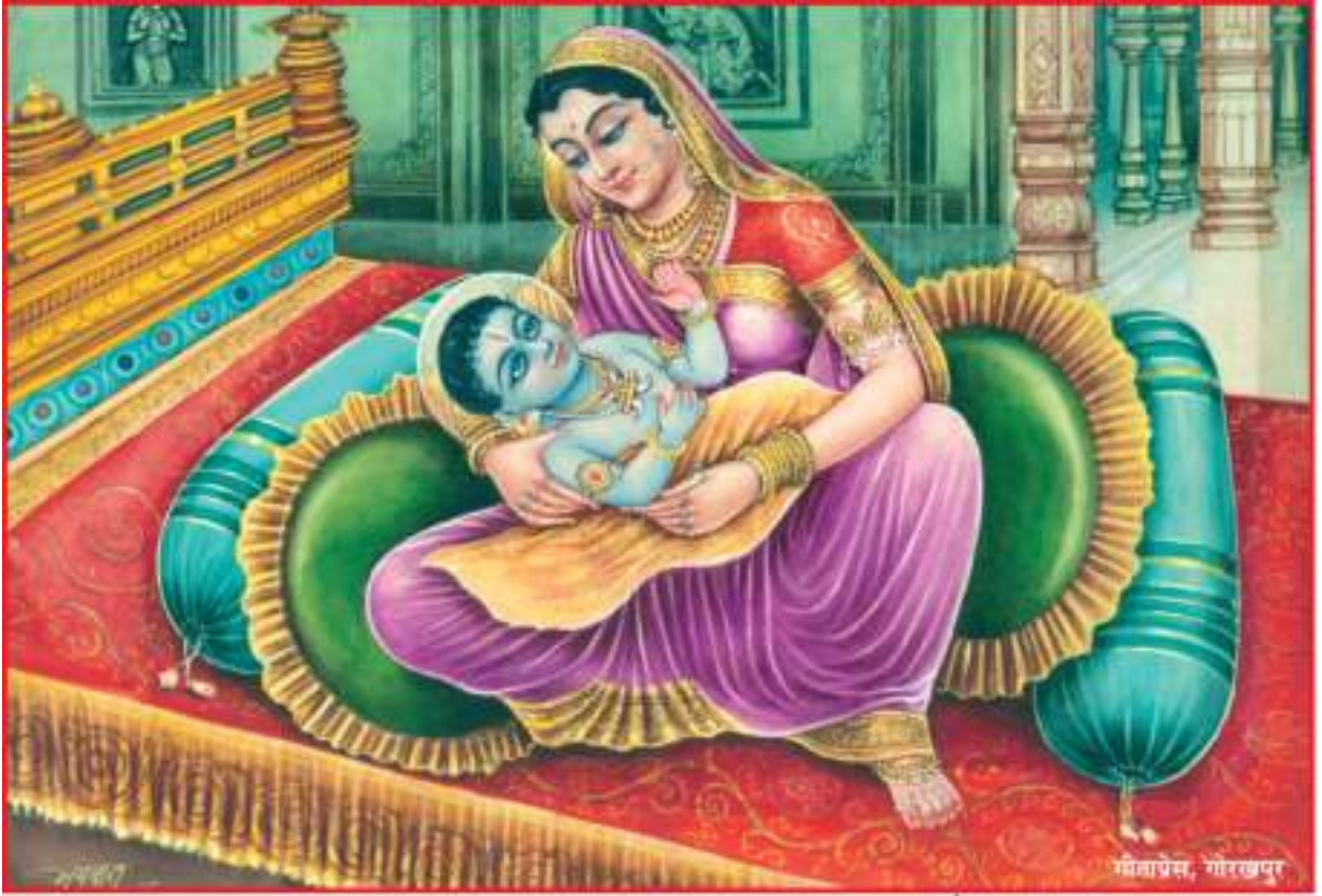
माता कौसल्याकी गोदमें परब्रह्म श्रीराम