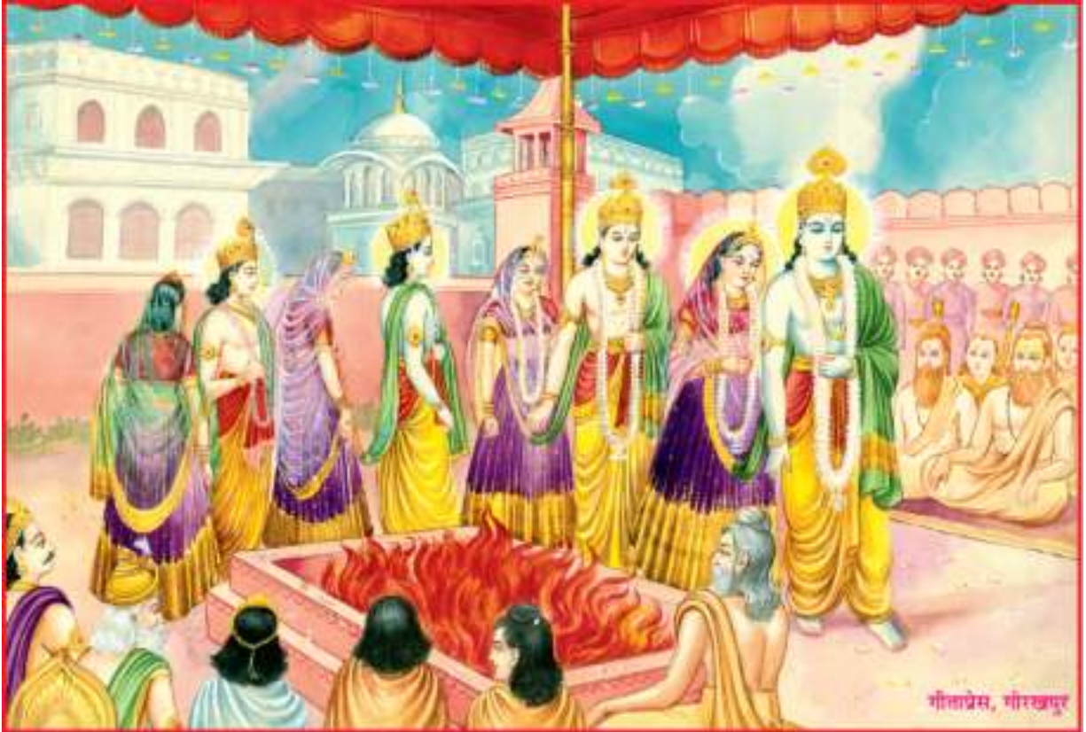
चारों भाई वर वेशभेरे