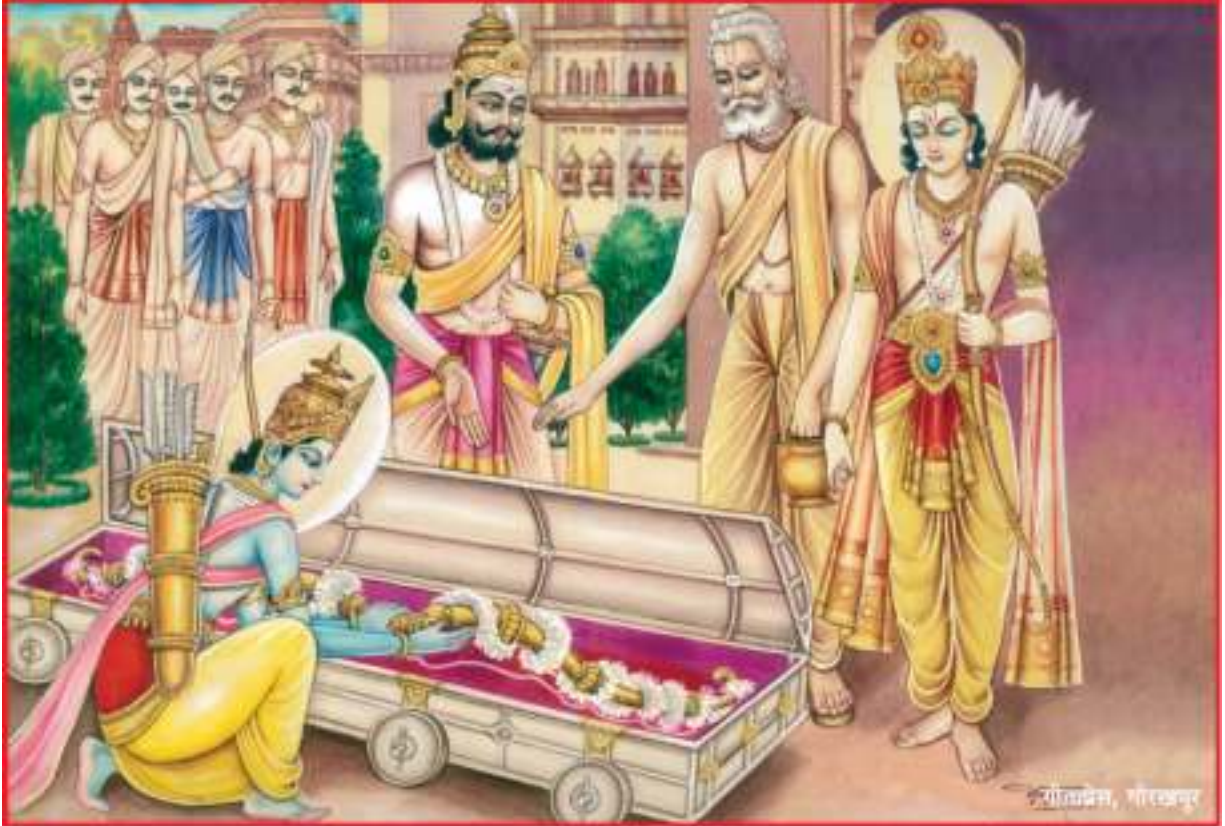
श्रीरामद्वारा धनुष उठाना